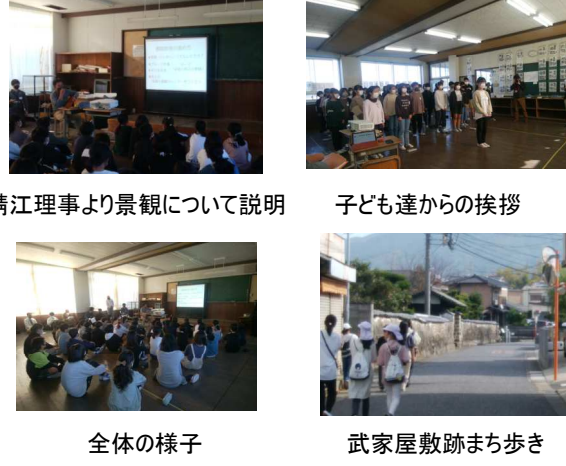
鯖江理事より景観について説明

11月11日(金)、16日(水)の両日、3年ぶりに小学生を対象にした「景観教室」を開催しました。今回は深堀小学校にての開催でした。 1日目は、景観についての説明や、配られた写真を見たうえで「いい景観」と「もっと良くなる景観」について、またその理由について班に分かれて話し合いました。その後、6班に分かれてまち歩きをおこない、実際のまちを見ながら「いい景観」「よくない景観」の写真を撮りました。 2日目は、子ども達が撮った写真の中から、「いい景観」3枚、「もっと良くなる景観」3枚を話し合いで選びだし、その理由についてそれぞれの意見を付箋に書いて模造紙に貼りました。最後は各班による発表を行いました。発表の際の写真の選択も投影も子ども達自身で行いました。早朝7時45分に深堀に集合したスタッフの皆様、お疲れさまでした