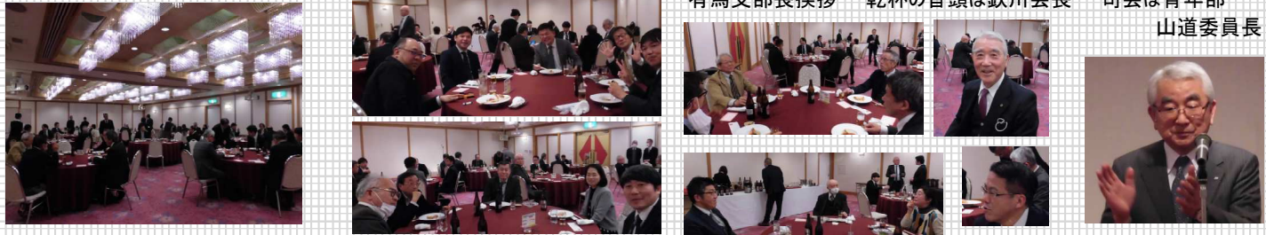
会場の様子 お久しぶりの顔も 静かに歓談 最後の締めは上山副支部長