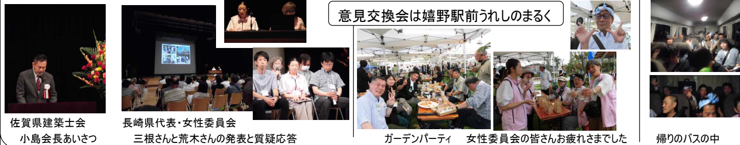
意見交換会は嬉野駅前うれしのまるく