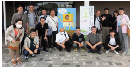
遅れて来た人 長崎支部 集合写真

6月24日(土)12:30より佐賀県・嬉野市社会文化会館リパティにおいて令和5年度の「建築士の集い」が開催されました。大会テーマは「TSU・NA・GU」。九州各県から400名を超える参加者があり、各県代表による地域実践活動発表において長崎県代表の女性委員会が神代小路の改修工事「伝建地区の保存への取組」を発表。長崎県からの参加者は55名。