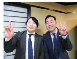
賛助会の皆さんもリラックスモード