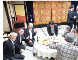
締めの方歳三唱は上山副支部長