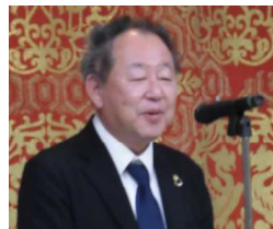
有馬支部長あいさつ

2月2日(金)18時30分より、中華街「会楽園」において新年懇親会を開催しました。長崎支部会員と賛助会員の皆様のみ、ほのぼのとした懇親会となりました。円卓を囲み懇親を深めました。参加者は42名。