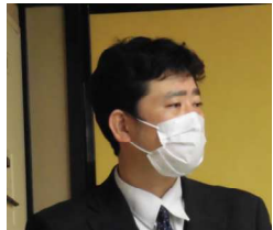
司会は山道青年部委員長