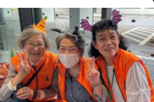
三人娘もはじける笑顔☆ まだまだ頑張ります!

先月開催された住宅フェアには、部会から19日6名、20日に4名がスタッフとして参加しました。ペーパーブリッジ、ミニブロックなど、老若男女問わず沢山の方に楽しんでいただき大盛況でした(^_^)! スタッフ参加して下さった皆様、ありがとうございます。 今後の例会は11月26日(火)18:30~長崎支部にて行います。ご参加お待ちしております♪