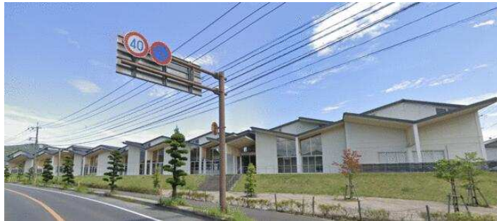
(嬉野市塩田中学校)