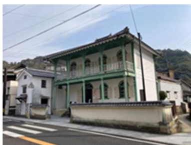
町屋（旧田代家西洋館）