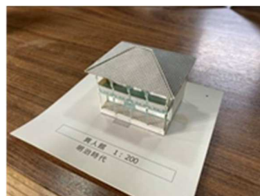
模型（旧田代家西洋館）