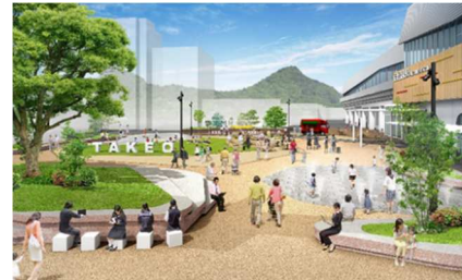
(武雄温泉駅前広場)