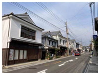
有田内山地区の街並み

有田町内山地区は重要伝統的建造物群保存地区に指定されており、ゴールデンウィークに行われる有田陶器市では全国からのたくさんのやきものファンで賑わいます。